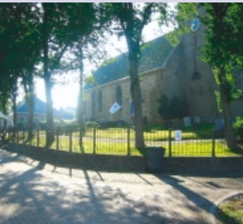
Een hoger gelegen kerkhof met boomsingel en beekwerk bij de Nederlands-hervormde kerk van Bears